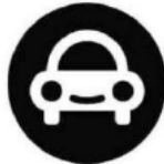
(iii) R 2502/2015-2

Die Unterscheidungskraft wurde hingegen im Entscheid (i) R 2502/2015-2 für Dienstleistungen der Klasse 35 und (ii) R 2434/2015-2 für die Waren der Klasse 9 für die folgenden Bildmarken bejaht: