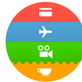
(iv) R 2434/2015-2

In den Entscheiden (i) und (ii) vertrat die Beschwerdekammer die Auffassung, dass es sich um nicht unterscheidungskräftige Zeichen handelt, die bei den entsprechenden Verkehrskreisen einen Eindruck hinterliessen würden. Im Entscheid (i) hielt die Beschwerdekammer fest, dass weder die leichten Abweichungen der Gesichtszüge, noch die Gesichtsausdrücke und -farben unterscheidungskräftig seien. Im Entscheid (ii) handle es sich um eine typische Abbildung eines Diagramms, das als Symbol für die beanspruchten Dienstleistungen in Verbindung gebracht werde. Die Abbildung weiche nicht derart von anderen typischen Diagrammen ab, dass sie geeignet wäre, die betreffenden Dienstleistungen zu individualisieren.